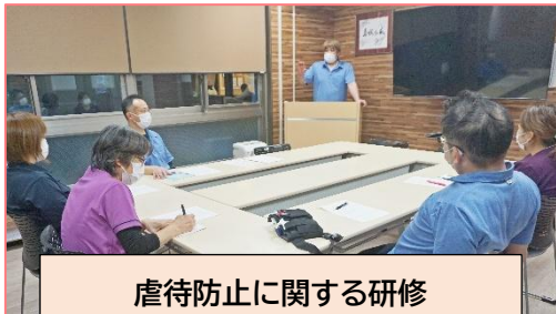
虐待防止に関する研修