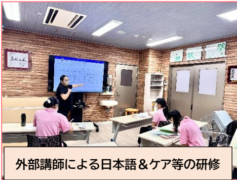
外部講師による日本語&ケア等の研修

大変真面目で何よりも優しい人柄の方たちです。今後も法人として全面的に成長を支援してまいります！