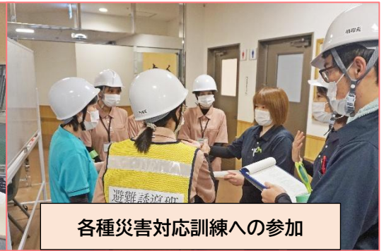
各種災害対応訓練への参加