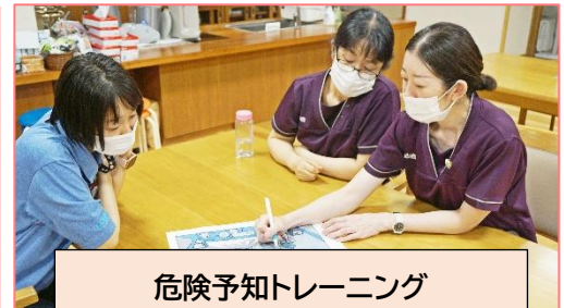
危険予知トレーニング