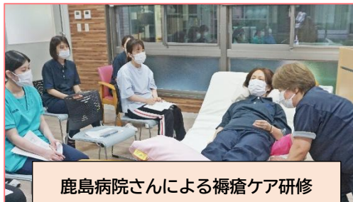
鹿島病院さんによる褥瘡ケア研修