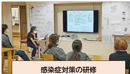
感染症対策の研修