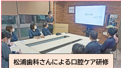
松浦歯科さんによる口腔ケア研修