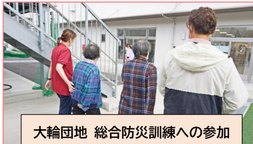
大輪団地 総合防災訓練への参加