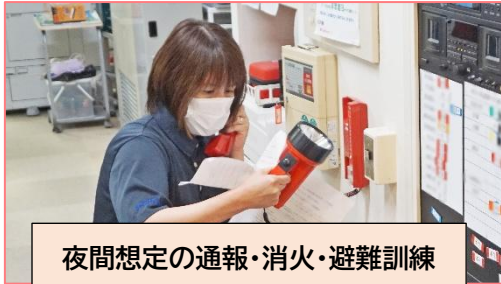
夜間想定の通報・消火・避難訓練

職員への法定研修や訓練が多数ある介護事業ですが、昨年度の後期に実施いたしました研修や訓練の一部をご紹介します。質の高いケアや有事の際に臨機応変に対応するため、当法人では人材育成委員会を中心に、年間の研修スケジュールを策定、人材育成を計画的に進めつつ、資格取得支援制度を活用し、キャリアアップに必要な書籍の購入や通信教育・講義受講の費用負担、受験日に合わせた勤務調整を行うなどして人材育成を進めています。