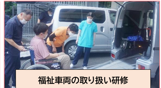
福祉車両の取り扱い研修