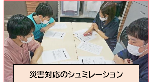
災害対応のシュミレーション