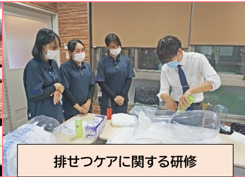
排せつケアに関する研修